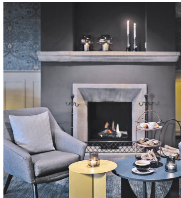
Hotel Schweizerhof Lenzerheide Lenzerheide schweizerhof-lenzerheide.ch