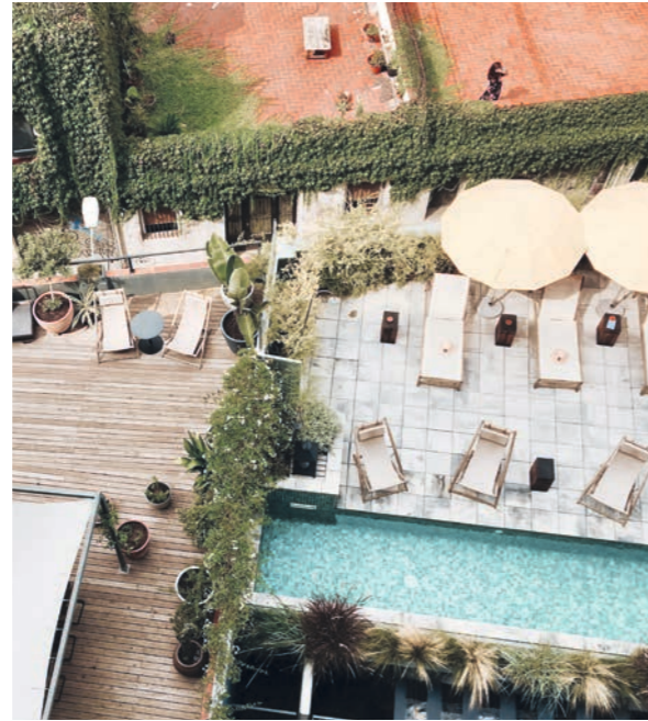
Hotel Brummell Barcelona hotelbrummell.com