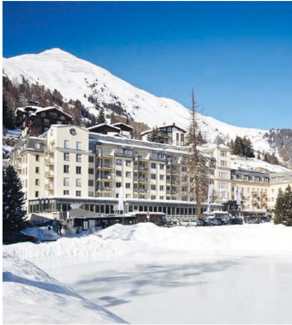
Precise Tale Seehof Davos precisehotels.com/davos

Exklusiv für die Wohnrevue testen ausgewählte Designer und Architektinnen Hotels in der Schweiz, Deutschland, Österreich und Italien. Alle bereits veröffentlichten Testberichte finden Sie unter: wohnrevue.ch