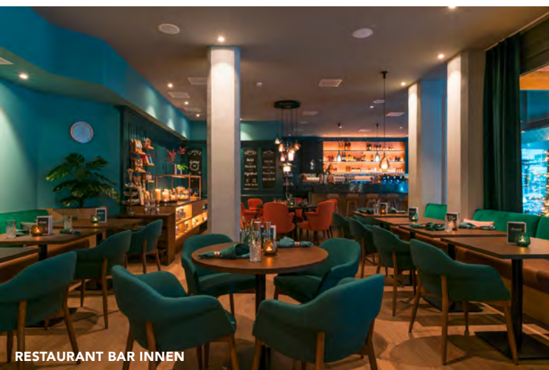
RESTAURANT BAR INNEN