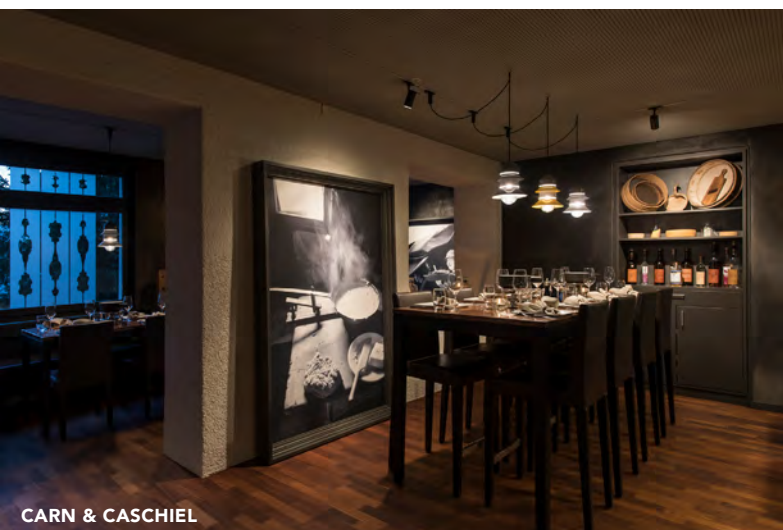
CARN & CASCHIEL