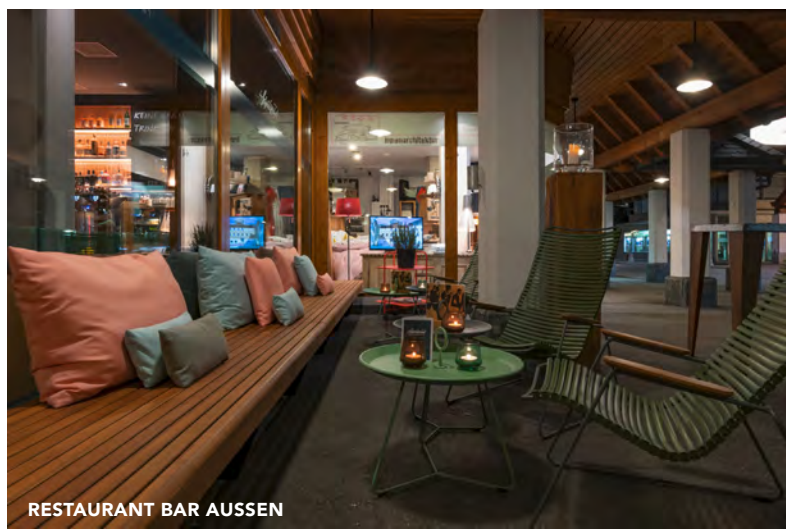
RESTAURANT BAR AUSSEN